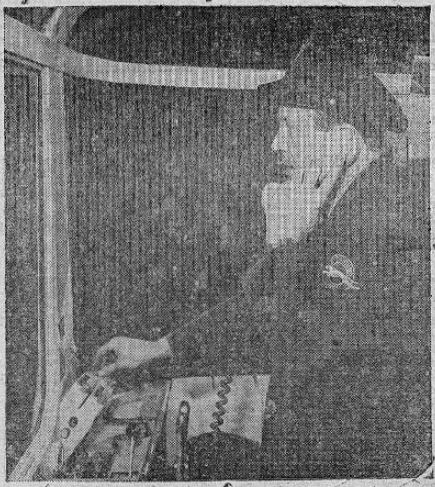
Un nuevo tipo de autobús de dos pisos que está siendo probado para rutas a través de los Estados Unidos, está equipado con radio de emisión y recepción para que el chofer pueda mantener en contacto constante con sus oficinas matrices. El aparato permite la comunicación inmediata en caso de necesidad y contribuye a mayor seguridad para los pasajeros. Este "Greyhound" también tiene un sistema de altoparlantes, y oculto en el espaldar de cada silla está un altoparlante de radio en forma de almohada que puede ser escuchado únicamente por el ocupante del asiento. El pasajero puede escoger una de dos estaciones radiodifusoras mediante la operación de un botón situado a la orilla del asiento.